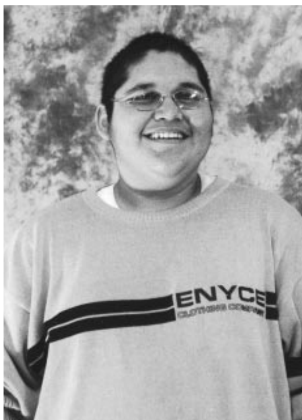
Santos, 16 "Elige tu camino cuidadosamente. Sé prudente."